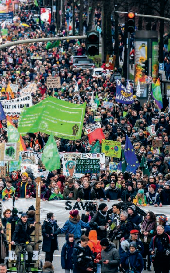
▲ Une marche du mouvement Fridays for Future en faveur du climat le 21 février, à Hambourg.